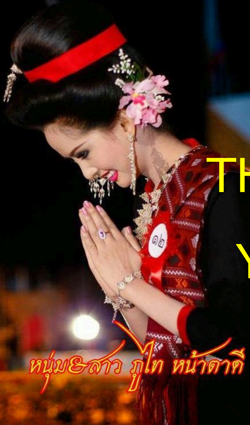
หนุ่ม&สาว ภูเก็ต หน้าตาดี