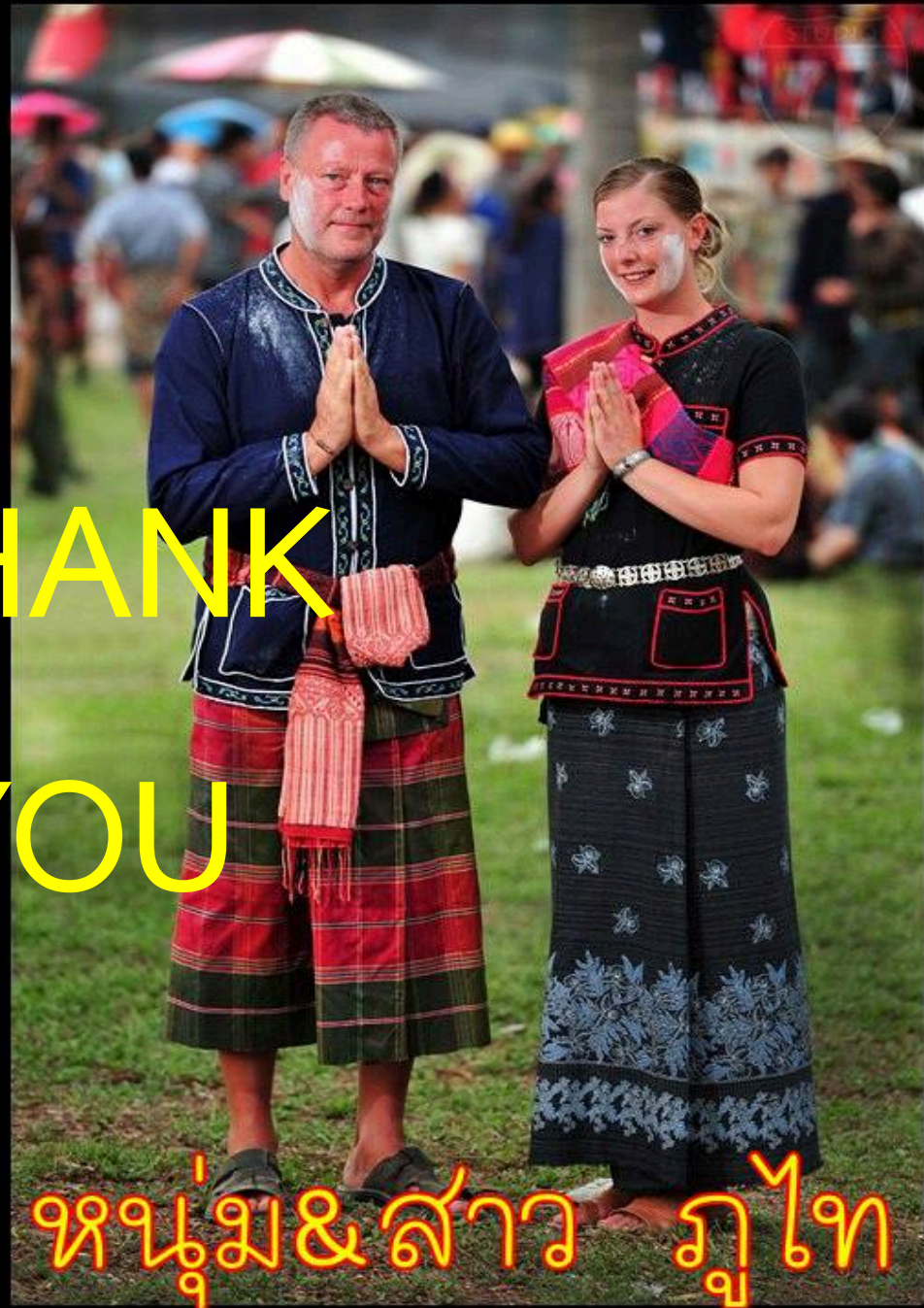
หนุ่ม&สาว ภูเก็ต